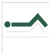
Jalkaosan nostokulma 0 - 28°