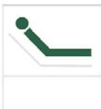
Selkänojan kallistuskulma 0 - 67°